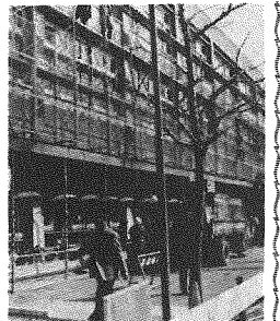
結婚式場を廃止してカールチュア教室に改修中

自転車置場が完成。紅谷町駐車ビル地下に。自転車置場の完成により、市民の利便性が向上する。置場の面積は、約千平方メートルである。