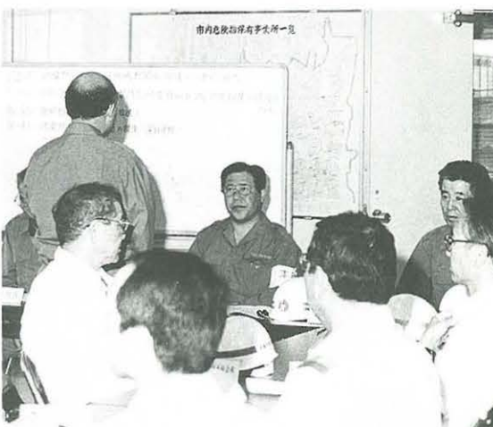
災害対策本部は震度5で自動的に設置される(昨年夏の防災訓練で)