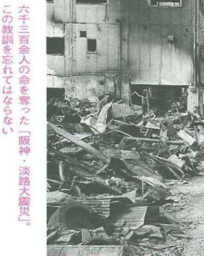
六千三百余人の命を奪った「阪神・淡路大震災」。この教訓を忘れてはならない