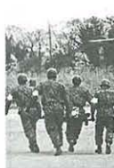
大神スポーツ広場は災害時にヘリポートとなる

◆直接自衛隊に災害状況を報告 ▽災害対策基本法の改正を踏まえ、県知事に要請できない場合は自衛隊に直接通報できることとする ▽自衛隊のヘリポート、車両基地、および宿営地を、これまでの学校から大神スポーツ広場等に変更する ◆市民、自主防災組織の協力体制の整備 ▽自主防災組織の活動や行政への協力を効果的に行うため、自主的に行う活動と、市に協力する活動などについて具体的に定める