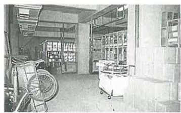
平塚球場スタンド下の備蓄品

意識を高めるよう求めています。 市でも地震防災対策の見直しにあたり、行政の対応の限界をカバーするため自主防災組織の機能の強化を図ります。また、災害の実態に即した訓練や啓発事業を実施して、市民の自主防災意識を高めるよう努めます。 ◆応急対策の充実と円滑な推進 災害に強いまちづくりを進めるためには、いざというときの行政への市民のみなさんの協力はもとより、日ごろからの備えや自主防災組織が行う訓練への参加などが欠かせません。ぜひ「大地震にも揺るがないまちづくり」にご協力