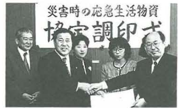
様々な団体・機関と提携を