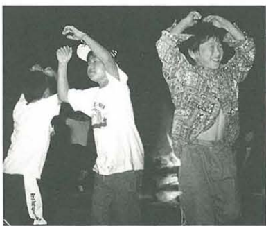
キャンファイヤーで

◆申し込み・問い合わせ先 びわ青少年の家・住所 土屋2710-1・☎59-0871