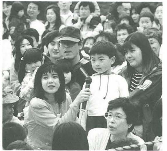
大にぎわいの野外ステージ前（昨年の様子）

春の一大イベントとして親しまれている緑化まつりが、四月二十八日（日）から三十日（火）までの三日間、総合公園を会場に開催されます。