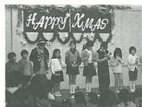
ハンドベルの演奏披露