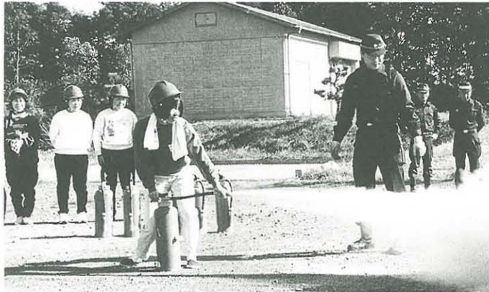
消火器の取り扱いを学ぶ