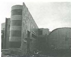
5月末に開所する 仮称南部福祉会館

▽仮称南部福祉会館、仮称万田デイサービスセンターの完成を機に多様な健康・福祉サービスを提供