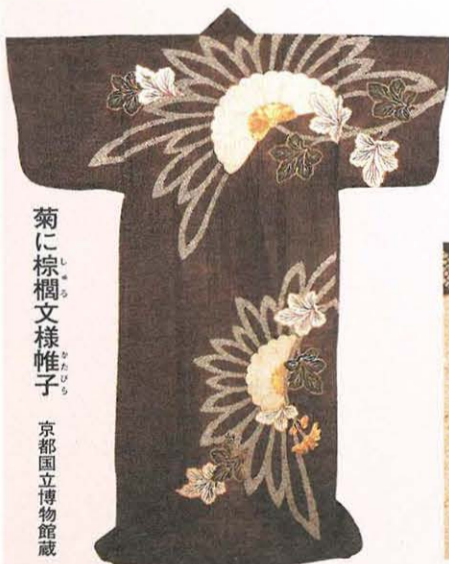
菊に棕櫚文様帷子

帷子とは裏のないひとえのきもので、素材は麻を使っています。棕櫚は、このころから観葉植物として栽培されはじめ、きもの模様にも取り入れられました。