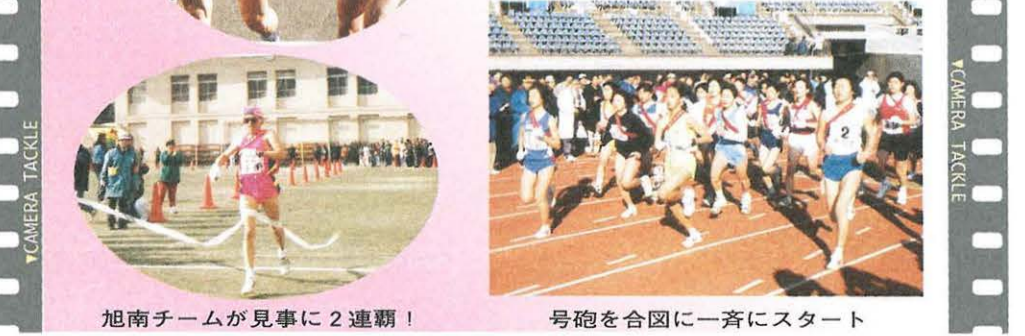
旭南チームが見事に2連覇! 号砲を合図に一斉にスタート

1月14日(日) 「第47回市内一周駅伝競走大会」 平塚に初春の訪れを告げる「市内一周駅伝競走大会」。平塚競技場から山城中学校までの全6区間、33.6kmを、市民休養の郷・天城湯ヶ島町チームも含め、24チーム、144人の選手が駆け抜けました。沿道からの温かい声援に、選手もよりいっそう奮起!