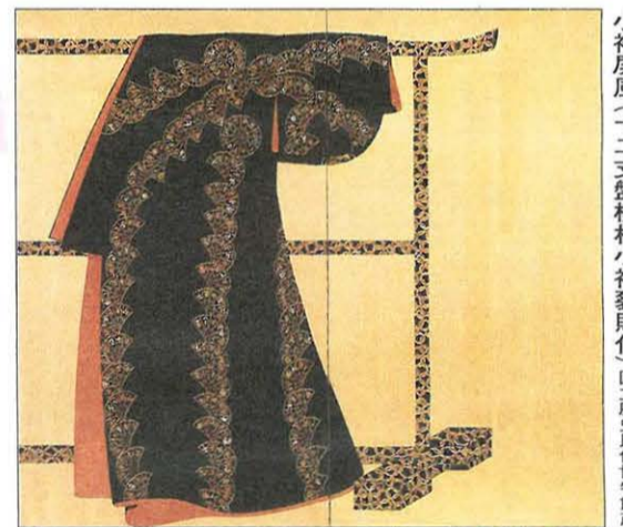
小袖屏風(十二支盤模様小袖裂貼付) 国立歴史民俗博物館蔵

当時の絵画作品には、きもを実際に着た姿が多く描かれています。ここに描かれた女性は、雪輪模様の小袖をゆったりと打掛けて、右手には橘の花を持っています。現代のきものと比べると袖が短く、まるいのがわかります。