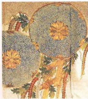
竹に栗鼠梅文様振袖