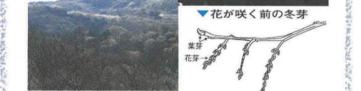
▲春の雑木林(土屋) 春を告げるキブシ

三月も終わりに近づくと、木々の芽がふくらみ始めます。雑木林も、遠くからは薄緑色のものがかかったように見えます。この時期、春の花の先陣を切って咲く花にキブシがあります。数珠のように連なって垂れ下っている黄緑色の花を、見かけたことがある方も多くはないでしょうか。市内では、湘南平や土沢地区などで普通にキブシを見ることができますが、市街地ではまったく見つけられません。そうした意味では、春の使者キブシも滅びゆく植物の一つといえるでしょう。 キブシの木には雄と雌があります。花が終ると房ごと地上に落ちてしまうのが雄の木、房が枝に残り、やがて緑色の丸い実に変っていくのが雌の木です。雄と雌のどちらが多いか、調べてみるのも面白いですね。 (担当 博物館)