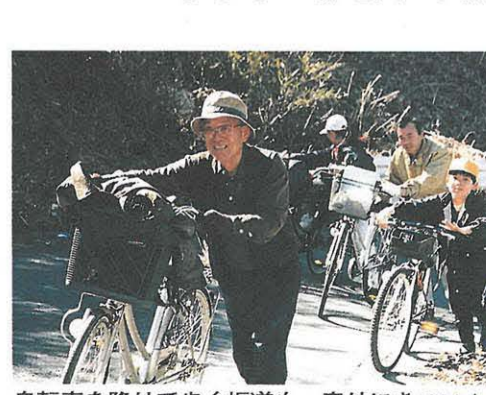
のどかな風景の中を自然を楽しみながら