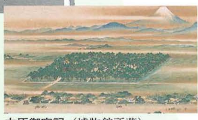
中原御宮記 (博物館所蔵)