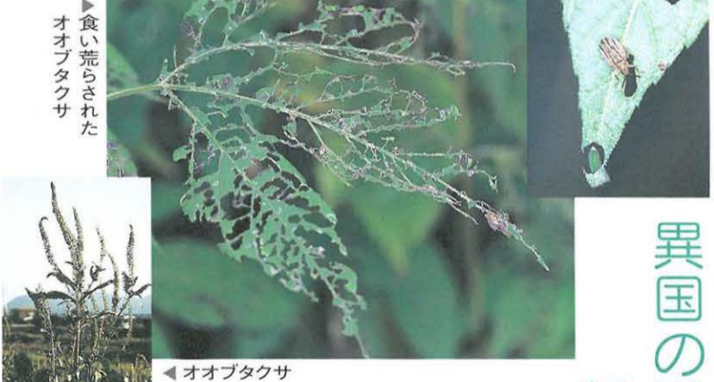
食べ荒らされたオオブタクサ