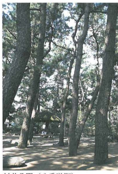
村井公園 (八重咲町)