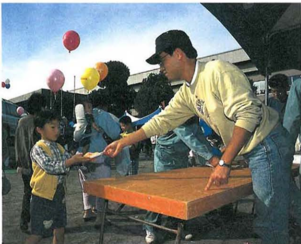
おたのしみコーナーではおもちゃの配布も