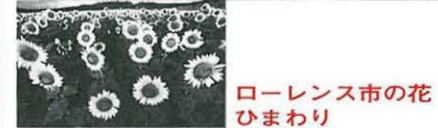
ローレンス市の花 ひまわり