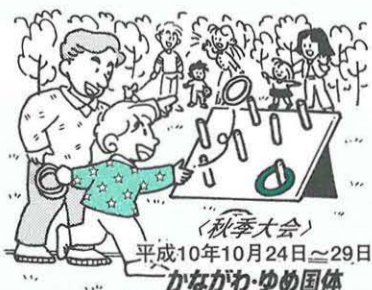
(秋季大会) 平成10年10月24日～29日 かながわゆめ国体

'96湘南ひらつかスターライトフェスティバルの会場で、国体マスコットの「かなべえ」がみなさんをお待ちしています。 ◇日時 12月22日(日)午後1時～ ◇会場 紅谷パールロード ◇内容 ①輪投げゲーム ②国体パネル展 ◇問い合わせ先 国体推進課(内線152)