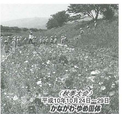
かながわゆめ国体平塚市実行委員会

平塚市では、国体に向け市民のみならず一人一人が、それぞれの立場で参加していただく3つの運動(スマイルアップ、ヘルスアップ、クリーンアップ)を進めています。一人一人の力が集まれば大きな輪に広がります。国体に向け、あなたにできることから始めてみませんか。 ☆クリーンアップ(きれいに) ・花いっぱい、緑いっばいにしよう ・まちをきれいにしよう 写真は緑化団体により行われている花水川での花づくり ◇問い合わせ先 国体推進課(内線152)