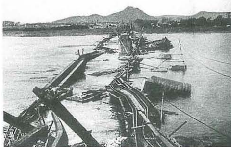
関東大震災 馬入川鉄橋の惨状

平塚市史第7巻「資料編近代(3)」を発行しました(A5判866ページ)。大正8年の第一次世界大戦の講和から、同12年の関東大震災、昭和4年の市制施行を経て、太平洋戦争下の生活までの資料を掲載しています。この「市史」は、図書館や公民館などでご覧いただけます。また、ご希望の方には販売もしています。(1冊6,000円)