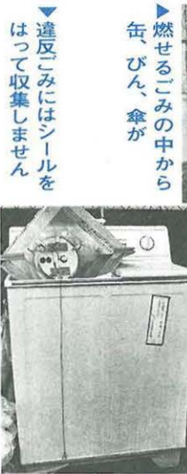
燃せるごみの集積所

資源ごみは「分別」と「出し方」が命です。資源ごみとして生き返るか、ただのごみになってしまふかは、ごみを出すときに決まります。私たち一人一人がかけた小さな「手間」が、リサイクルの推進や、ごみ処理費用のコストダウンにつながるります。