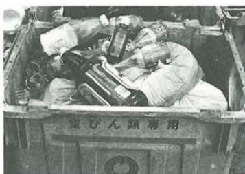
袋は持ち帰って燃せるごみに

資源ごみは「分別」と「出し方」が命です。資源ごみとして生き返るか、ただのごみになってしまふかは、ごみを出すときに決まります。私たち一人一人がかけた小さな「手間」が、リサイクルの推進や、ごみ処理費用のコストダウンにつながるります。