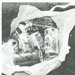
燃せるごみの中からの空き缶

燃せるごみは「分別」と「出し方」が命です。資源ごみとして生き返るか、ただのごみになってしまふかは、ごみを出すときに決まります。私たち一人一人がかけた小さな「手間」が、リサイクルの推進や、ごみ処理費用のコストダウンにつながるります。