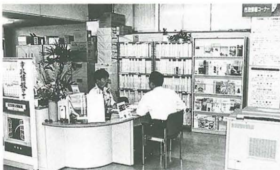
市役所3階の市政情報コーナー