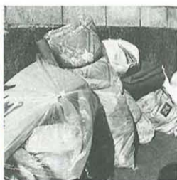
大きなふとんは「臨時ごみ」に

資源ごみは「分別」と「出し方」が命です。資源ごみとして生き返るか、ただのごみになってしまふかは、ごみを出すときに決まります。私たち一人一人がかけた小さな「手間」が、リサイクルの推進や、ごみ処理費用のコストダウンにつながるります。