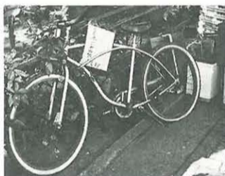
自転車には必ず「資源ごみ」と表示(はり紙をする)

資源ごみは「分別」と「出し方」が命です。資源ごみとして生き返るか、ただのごみになってしまふかは、ごみを出すときに決まります。私たち一人一人がかけた小さな「手間」が、リサイクルの推進や、ごみ処理費用のコストダウンにつながるります。