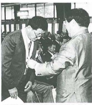
表彰される受賞者のみなさん