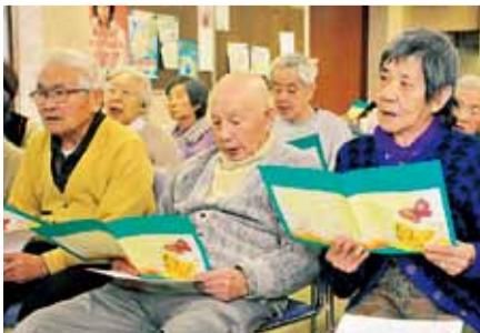
ひらつか市民合唱祭の歌を練習