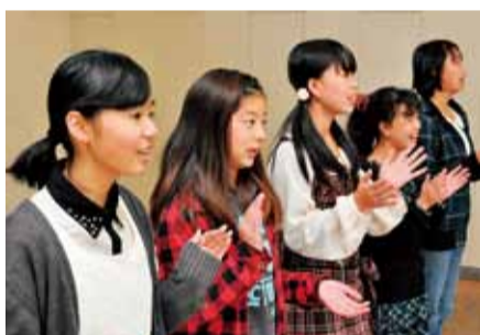
クリスマスコンサートの練習に励む