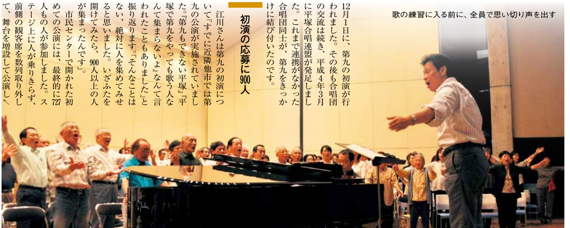
歌の練習に入る前に、全員で思い切り声を出す

12月1日に、第九の初演が行われました。その後も合唱団の交流は続き、平成4年3月に平塚合唱連盟が発足しました。これまで連携がなかった合唱団同士が、第九をきっかけに結び付いたのです。