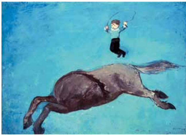
1930年頃 油彩・キャンバス 72.8センチ×100.2センチ

本作は12月7日(土)~平成26年2月9日(日)に開く「所蔵名品展 I 美術館で遊ぼう!!」で展示します。(文:市美術館学芸員 安部)