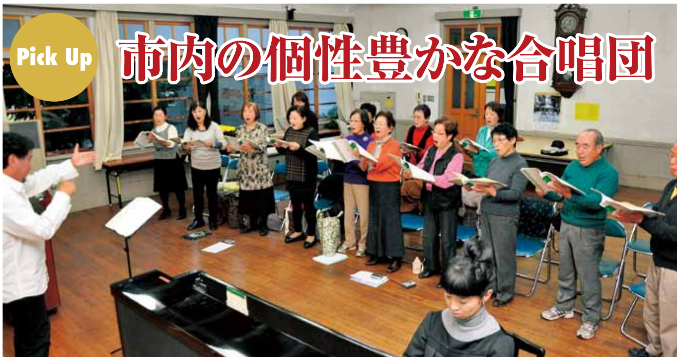
崇善公民館で練習に励む湘南グロリアの皆さん