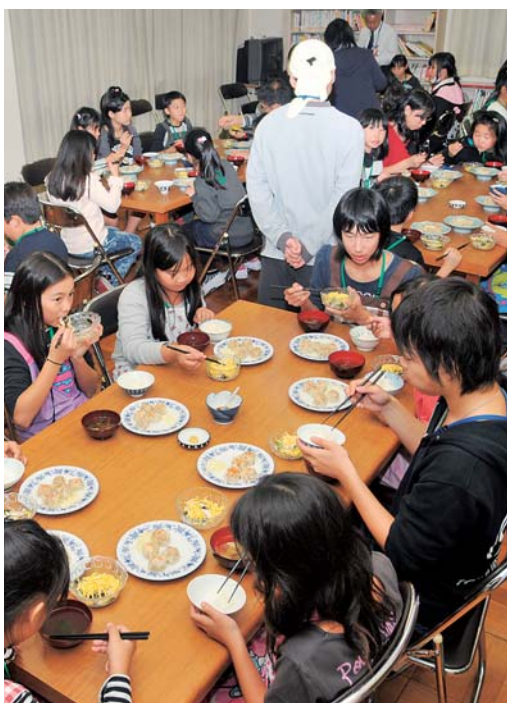
みんなで食べると、おいしいね

もたちが集まった金目公民館の図書室に、にぎやかな声が響きます。金目地区で、平成25年11月10日（日）～12日（火）