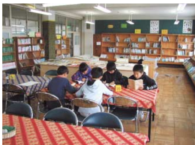
図書室で読書する子供たち(岡崎小学校)

議員 計画策定の組織には、学校図書ボランティアなど現場に近い方を入れてもらいたい。また、パブリックコメント手続きを取り入れる考えがあるのか聞きたい。