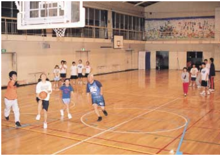
地域の方が指導する旭陵中学校バスケットボール部の練習

議員 十六年度はどのように取り組むのか。教育長 現在、各校で二学期制の試行または三学期制で研究を行うのか検討中である。今年度の試行校の研究結果を生かして、教育効果を上げる手立て等についてさらに研究を進めていきたい。