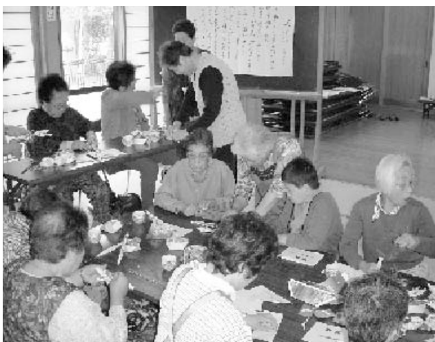
金田福祉村のふれあいサロン

議員 第三次実施計画策定のためのたき台の中で、地域の高齢者から子供まで、お互いに支え合う仕組みづくり、環境整備を進めたいと考えている。