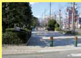
中原上宿遺跡公園

この新道を見通してみると、道路自体は直線的なのですが上下に大きくうねっているのがわかります。これは、東西方向の砂州・砂丘が幾重にも並ぶ市街地を南北に貫いて道路が作られているためです。低地には周囲の水が集まって流れを作ります。発掘調査にあたり南部の調査区ではこうした流れの一つ「谷川」を横切り、中部の調査区では日枝神社が立地する砂州・砂丘の微高地を探り、そして北部で渋田川左岸の自然堤防由来の微高地に達するという具合に、地形が変化する場所