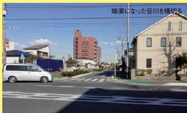
暗渠になった谷川を横切る