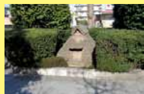
弥生時代の竪穴住居模型

現在「遺跡公園前」というバス停がありますが、公園はバス停から50mほど北、中原二丁目北交差点の北西側の歩道上に整備されています。竪穴住居址や井戸など検出した遺構のモデルが歩道面に表示され、説明板や住居の模型も置かれています。平塚のまちの成り立ちを知る重要な遺跡群ですから、本来ですと全域を保存して歴史公園として後世に伝えたいところですが、地域の暮らしにとって必要な道路を作らないわけにはいきません。歴史遺産と現在の生活をどのように共存させていくか、問いかげられる場所でもあります。