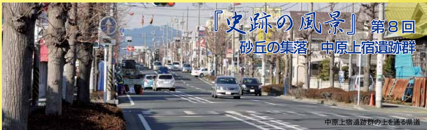
中原上宿遺跡群の上を通る県道

平塚を中心として放射状に広がる道路網は湘南地区と県央地区を結ぶ大動脈です。そのひとつ、平塚市と伊勢原市を結ぶ県道平塚伊勢原線の中原地区での新道建設にあたり、昭和53年（1978）8月から翌年の6月にかけて大規模な発掘調査が実施されました。大松寺前から渋田川に至る道路予定地に設定された発掘調査区は延長700mを超え、南から北へ上宿遺跡、厚木道遺跡、山王脇遺跡、大縄橋遺跡の4遺跡を通っています。発掘調査の成果は「中原上宿遺跡群」としてまとめられました。