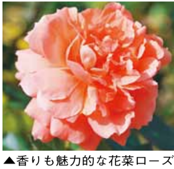
▲香りも魅力的な花菜ローズ

同園では、世界39カ国のバラの団体が加盟する世界バラ会連合の世界大会で殿堂入りしたバラを、プレート付きで紹介しています。その中でも、代表的な品種の一つが「ピース」です。花びらが淡い黄色で、縁がピンク色になっているのが特徴です。第二次世界大戦中に誕生したこのバラは、平和への願いを込めて、平和を意味するピースと名付けられました。色や香りを楽しみながら、そのルーツを考えてみるのも面白いですね。