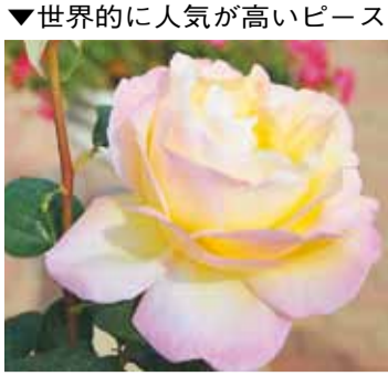
▼世界的に人気が高いピース