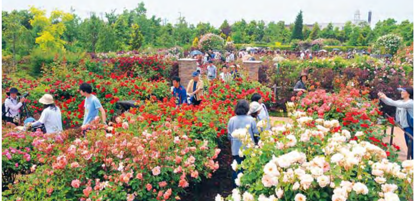
薔薇の轍でツルバラを楽しむ来園者たち

5月10日(土)～6月1日(日)は午前8時30分～午後5時。通常は9時開園です。大人520円など。期間中は、平塚駅から直通のバスも運行します。