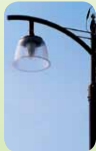
新しくなった街路灯

見込みです。また、蛍光灯よりも長期間使用できることで、電灯の交換などの維持・管理費用の削減も見込めます」とその効果を語ります。