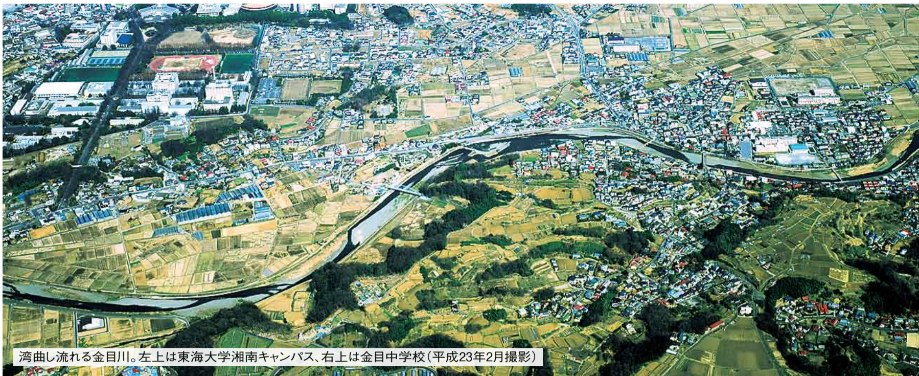
湾曲し流れる金目川。左上は東海大学湘南キャンパス、右上は金目中学校(平成23年2月撮影)