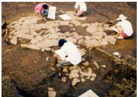
発掘調査中の敷石住居跡