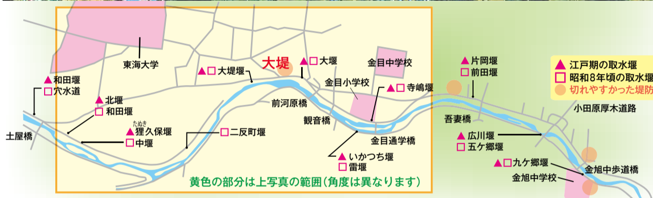
江戸～昭和初期の金目川の堰位置と切れやすかった堤防(「博物館春期特別展図録・水と生きる里 金目の風土とその魅力」付図をもとに作成)