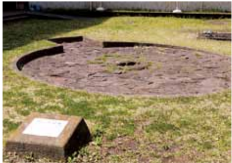
復元した上ノ入遺跡の敷石住居

こうした柄鏡形の平面を持つ竪穴住居は、縄文時代中期の終わりから後期にかけて関東地方から中部地方を中心に作られました。この住居が特殊な祭りに使われたのか、一般的な住まいであったのか、まだまだ謎に包まれています。