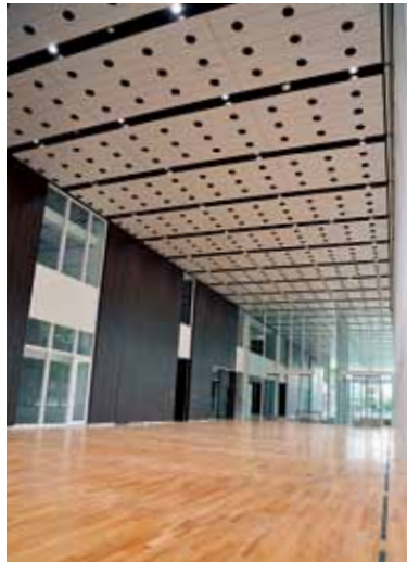
1階 多目的スペース ㉒