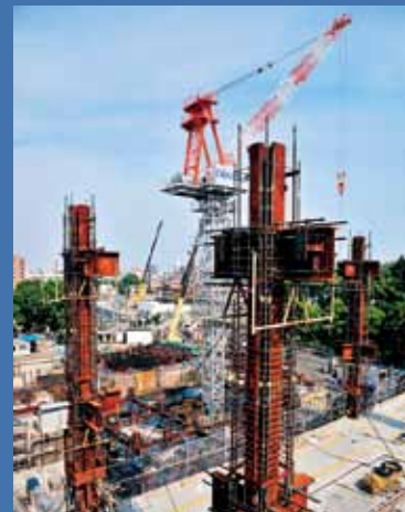
←⑤クレーンを使って資機材をつり上げ