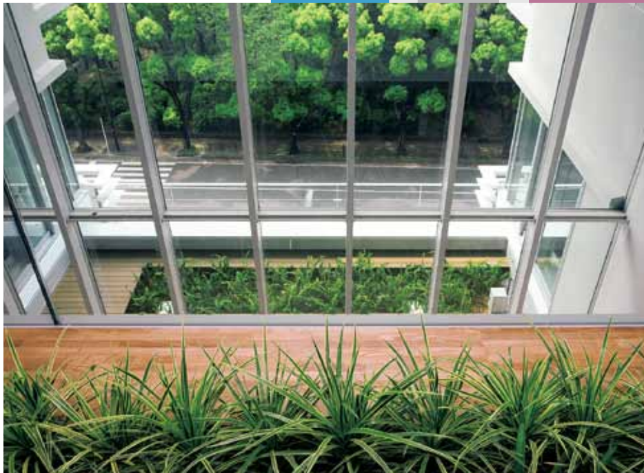
5階 八幡山公園とつながって見える、新庁舎の内外の植栽