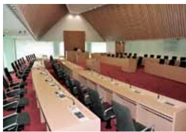
8階 議場 ㉑