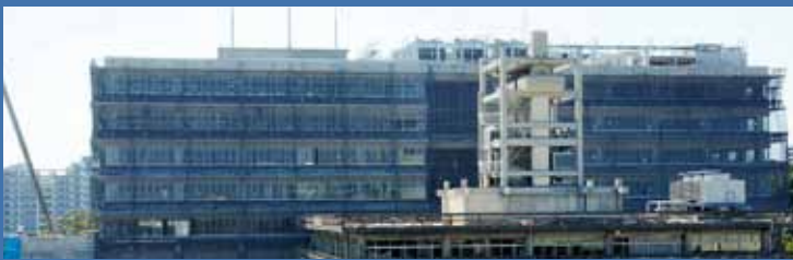
→⑥教育会館屋上から撮影した新庁舎