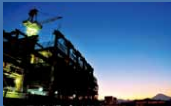
←③旧庁舎の屋上から撮影した夕暮れの新庁舎 →④クレーンを使って鉄骨を組み上げる