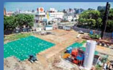
←①汚染土壌を掘削し、運び出す