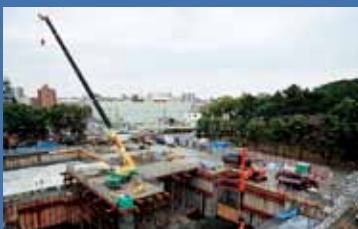
→②基礎部分にコンクリートを流し込む