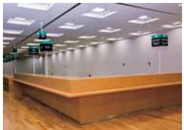
1階 市民課窓口 ㉓