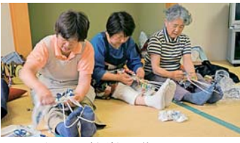
誰でも簡単に作れます

8月29日(金)午前9時~正午。リサイクルプラザ。16人(抽選)。布・物差し・ピンセットなど。