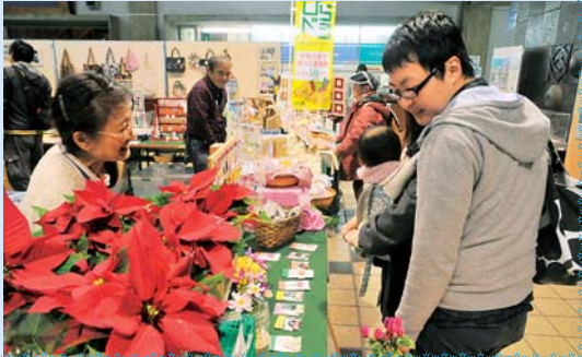
旧庁舎での展示即売会