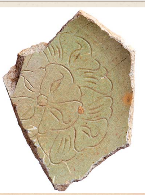
平塚で出土した緑釉陶器

遺跡調査・研究発表会 平成24・25年度に発掘調査した9遺跡の成果を発表します。また、奈良・平安時代に相模国府が置かれていた平塚で多く出土する緑色の高級陶器「緑釉陶器」についての講演と展示もあります。