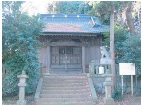
八剱神社(上吉沢) 2005年12月9日撮影