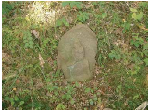
道祖神 2005年10月22日撮影