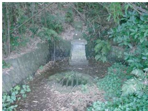
熊野神社井戸跡 2005年7月21日撮影