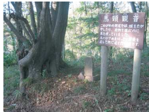
馬頭観音 2005年10月21日撮影