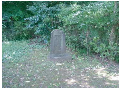
吉沢の池の水神 2005年7月21日撮影