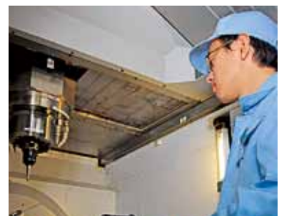
専門的な技術を学びます

が在籍しています。修了生の就職も、専門のスタッフがサポートし、就職率は9割を超えます。 また、企業に勤める従業員を対象としたスキルアップセミナーも開いており、企業の実情に応じて、さまざまな訓練講座を企画しています。セミナーの内容は同校ウェブでご覧になれます。 入校には、原則として、ハローワークへの登録が必要です。また、オープンキャンパスや、体験入校も定期的にご覧になれます。