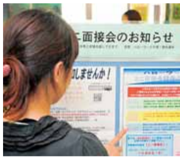
ミニ面接会の案内を見る女性

企業の求人情報を扱い、求職者に応じた職業を紹介しています。専用の端末で、希望する職種や地域に、どのような求人があるかを検索・確認できるほか、窓口で職業適性の検査や就職に向けての相談などができます。また、雇用保険の受給の手続きなどもできます。