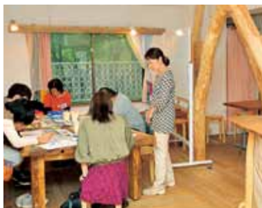
木造りの室内は温かな雰囲気

平塚市を含む県西部の自治体と連携し、15〜39歳の若年者の職業的な自立を支援しています。「就職したいが、どうすればいいかわからない」「社会に出るのが不安」などのさまざまな相談を受け付けています。初回は、まず本人の状況や気持ちを聞き取ります。相談内容に応じて、一人一人に合った支援プログラムを作成。自分の適性を知ったり、自信をつけたりするための