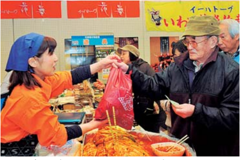
毎回好評のキムチも販売します