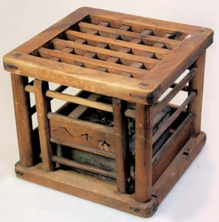
主に昭和30年代まで使われていました

写真の置きごたつは、夜寝る前に、布団の足元へ入れて暖めるために使われていました。寄贈者によると、7人兄弟だったので、暖まったら順々に次の布団へ入れていったそうです。アンカのような使い方がされており、寄贈者もこの置きごたつを「アンカ」と呼んでいました。博物館の寄贈品コーナー「白鷺家が語るくらしの今昔」では、置きごたつをはじめ、冬の寒さをしのぐために使われていた道具を、3月1日(日)まで展示しています。