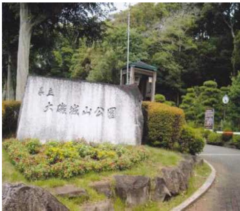
県立大磯城山公園