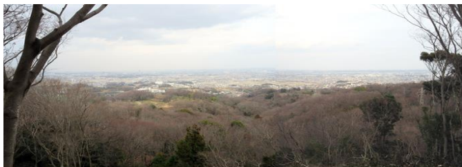
【日之宮神社・立石周辺整備（下吉沢）】