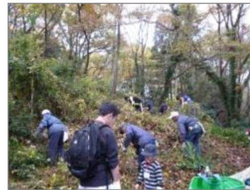
散策路沿いの草刈り (上吉沢)