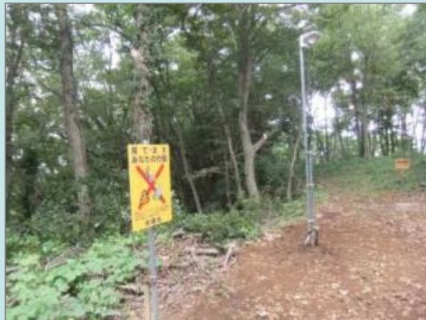
日中の人感センサー付きライトと看板

湘南ひらつか・ゆるぎ地区の散策路およびその周辺地（西部丘陵地の霧降の滝、松岩寺周辺地域）が、平成25年6月1日付で美化推進モデル地区に指定されました。 これを受けて、本協議会では不法投棄を抑止するために、以前協議会で不法廃棄物を撤去した場所に人感センサー付きライトや看板の設置を行いました。