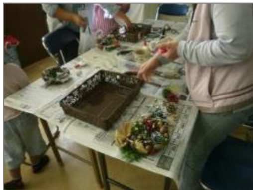
リースにクリスマスの装飾 (吉沢公民館)