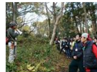
6月の里地里山に生息する 昆虫や植物の紹介を行います

※参加応募多数の場合、早めに締切りお断りさせていただく場合がございます。 予めご了承ください。