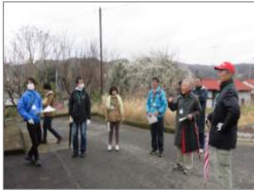
吉沢八景探し (めぐみが丘)