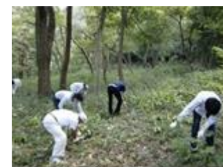
ササ類や草本類を刈取り 明るい林床にします