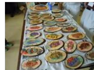
樹木の特徴など活かした 樹名板を作成します