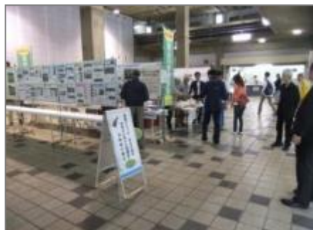
来訪者で賑う展示会