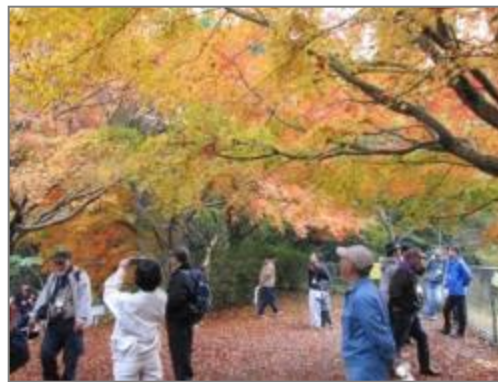
散策路整備中の植物観察 (中吉沢)