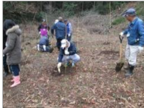
散策路の整備 (植樹) (上吉沢)