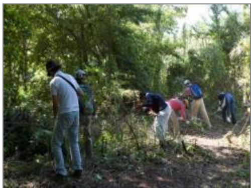
散策路沿いのササ刈り (上吉沢)