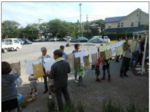
草木染めしたものを、外で乾燥 (吉沢公民館)