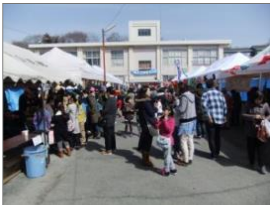
公民館まつりの様子

初日は天気にも恵まれ、当協議会では「吉沢八景プロジェクト」の募集を行いました。 また、2日間ともに、協議会の活動内容等をパネルにて展示し、ご来場された多くの人たちにご覧頂きました。