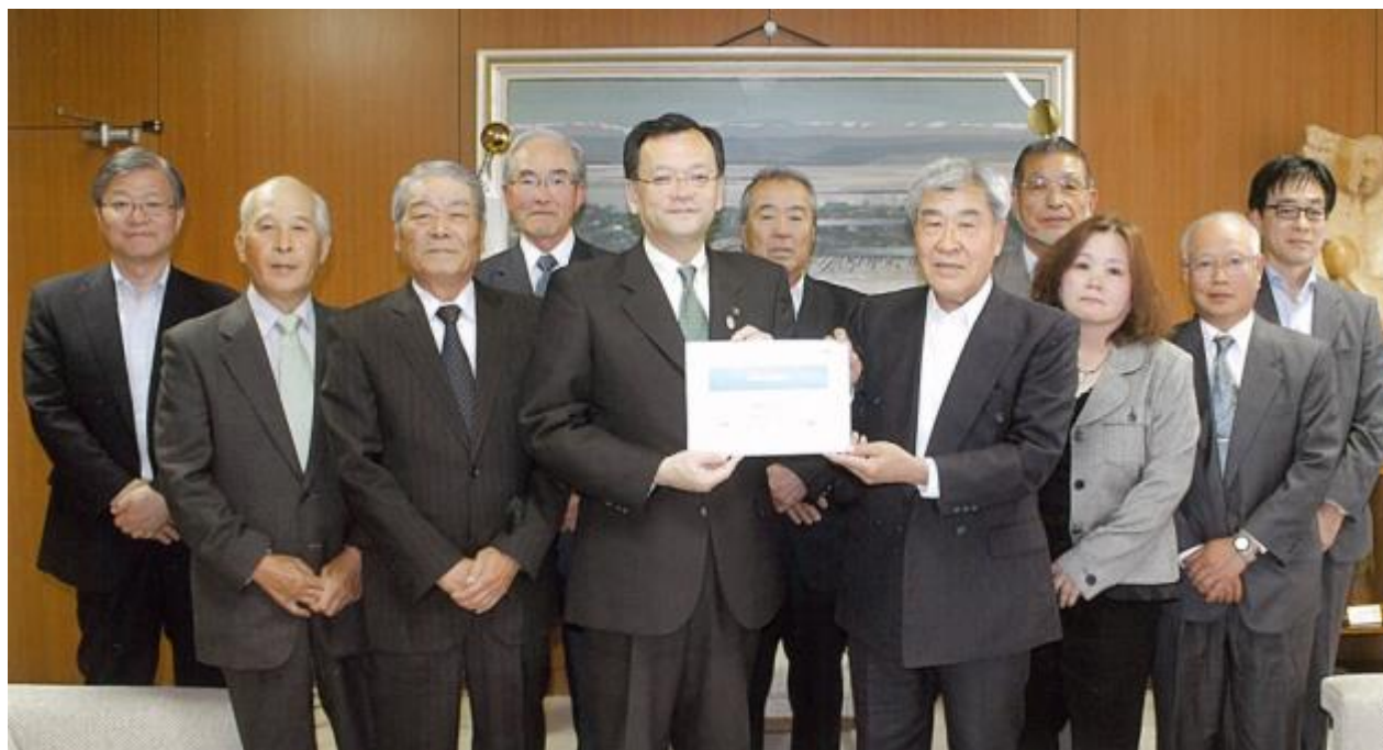
落合市長との面談の様子