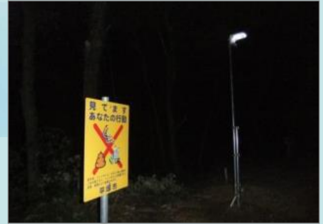
夜間の人感センサー付きライトと看板