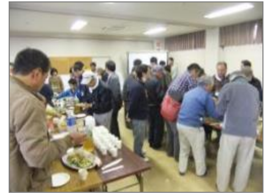
懇親会 (吉沢公民館)