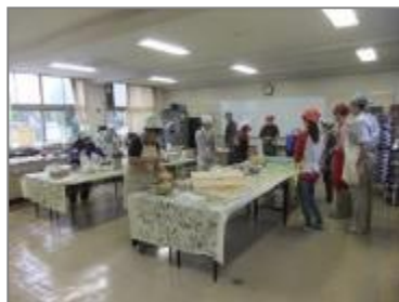
郷土料理づくり（吉沢公民館）