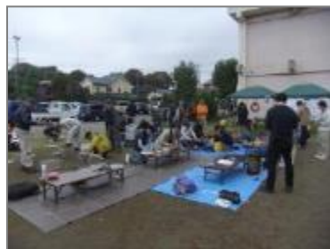
バードコールとリースづくり（吉沢公民館）