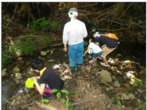
水質調査と水辺の生き物探し (中吉沢)