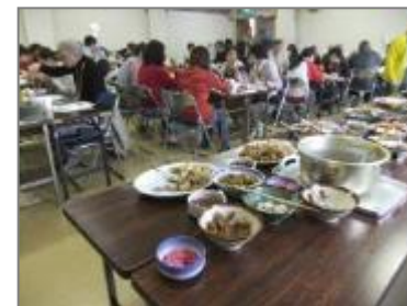
料理のふるまい（吉沢公民館）

★本協議会も指導役として参加し、また提供した食材を使った料理は好評を得ていました。