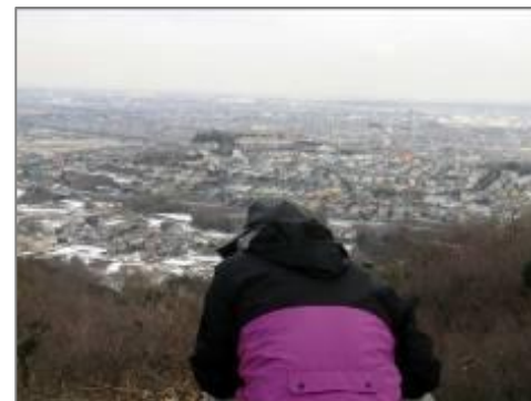
高台の展望地（下吉沢）