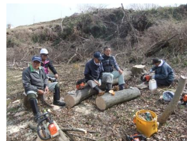
【山王山周辺整備（下吉沢）】