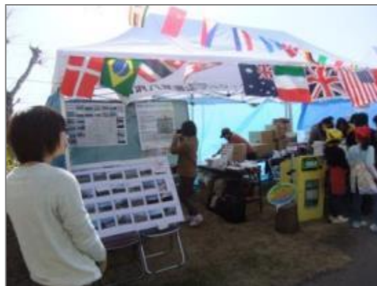
当協議会のブースの様子