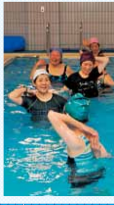
プールで健康づくり教室の様子。

①8月4日～9月29日の火曜日②8月6日～9月24日の木曜日、各全8回、午前9時30分～11時(初日は8時40分から)。南部福祉会館(袖ヶ浜20-1)。市内在住の60歳以上の方、各25人(先着順、初心者・参加回数の少ない方を優先)。水着・水泳帽・タオル。1回100円。 電話または直接、南部福祉会館☎21-3370へ。