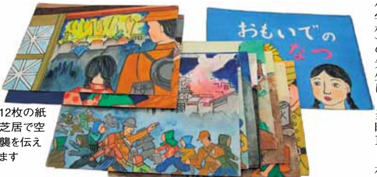
12枚の紙芝居で空襲を伝えます

「おもいでのはなつ」は、絵と言葉により空襲の様子だけでなく、空襲を受けた人の気持ちも伝えていきます。7月16日から開催する「平塚空襲70周年展」に展示します。