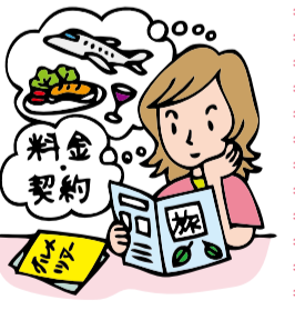
旅行契約の注意点について説明するイラスト。

カード番号を入力して送信し、旅行業者から承諾通知メールが到達した時に契約が成立します③申し込む前にパンフレットなどでキャンセル料を確認しましょう。契約成立の有無や解約の時期で金額が異なります④契約前に費用の総額を確認しましょう。パンフレットに掲載されている料金のほかに、空港施設使用料や外国の空港税などの費用を請求される場合もあります。 楽しい旅行が台無しにならないよう、契約内容をしっかり確認してから申し込みましょう。