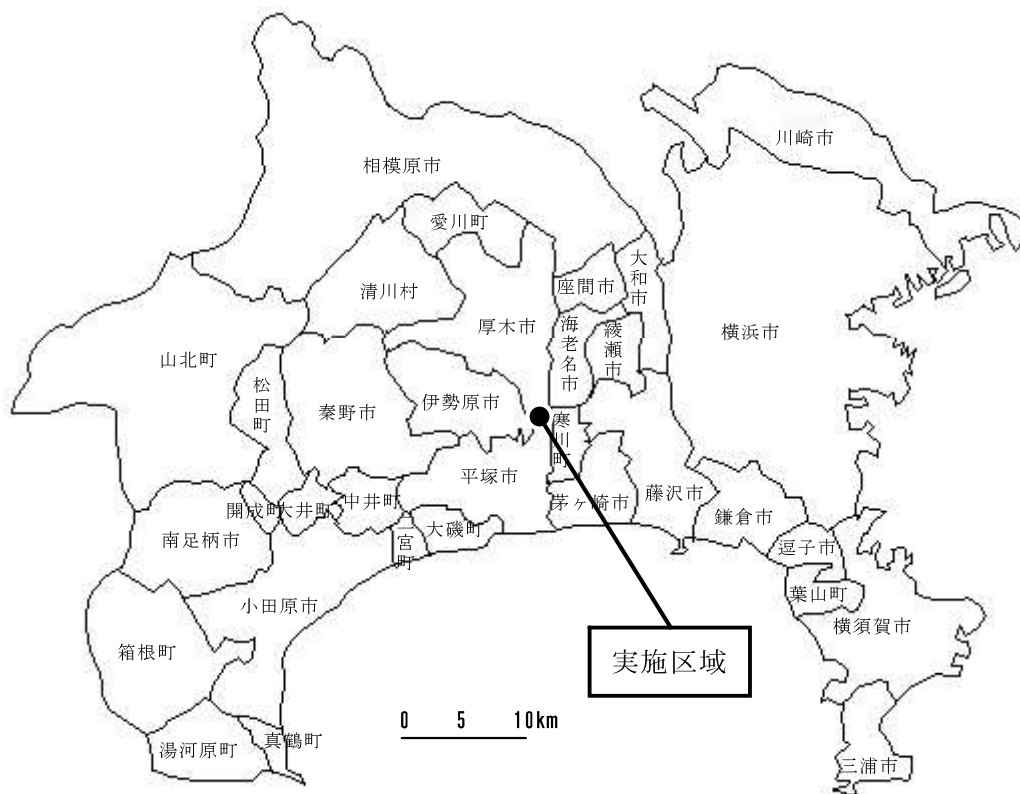
図 3.1.1 神奈川県における実施区域の位置