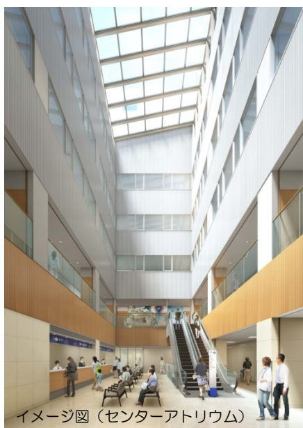
イメージ図 (センターアトリウム)