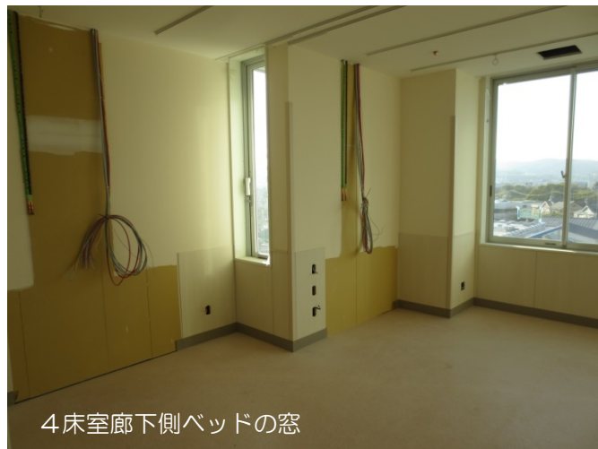
4床室廊下側ベッドの窓