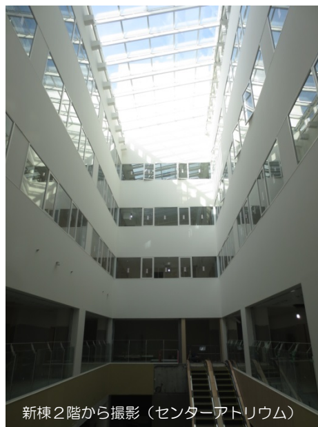
新棟2階から撮影 (センターアトリウム)