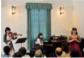
洋館で演奏しませんか

5月21日(土)・22日(日)、午前10時〜午後6時。旧横浜ゴム平塚製造所記念館。各日8組抽選。