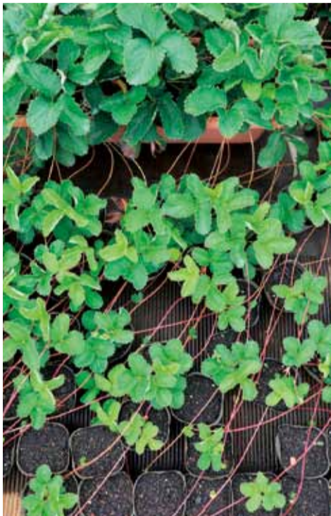
プランターに植えた親株からランナーが四方に伸びます