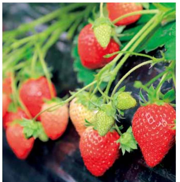
次から次へと実が赤くなります

12月25日、ハウス1棟で50パックほどの出荷ができるまでになりました。収穫の最盛期には300パックにもなり、4日間掛けて2棟のハウスを一巡するころには、初日に収穫した株には次の実が色付いています。