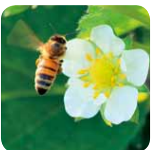
授粉に欠かせないミツバチ