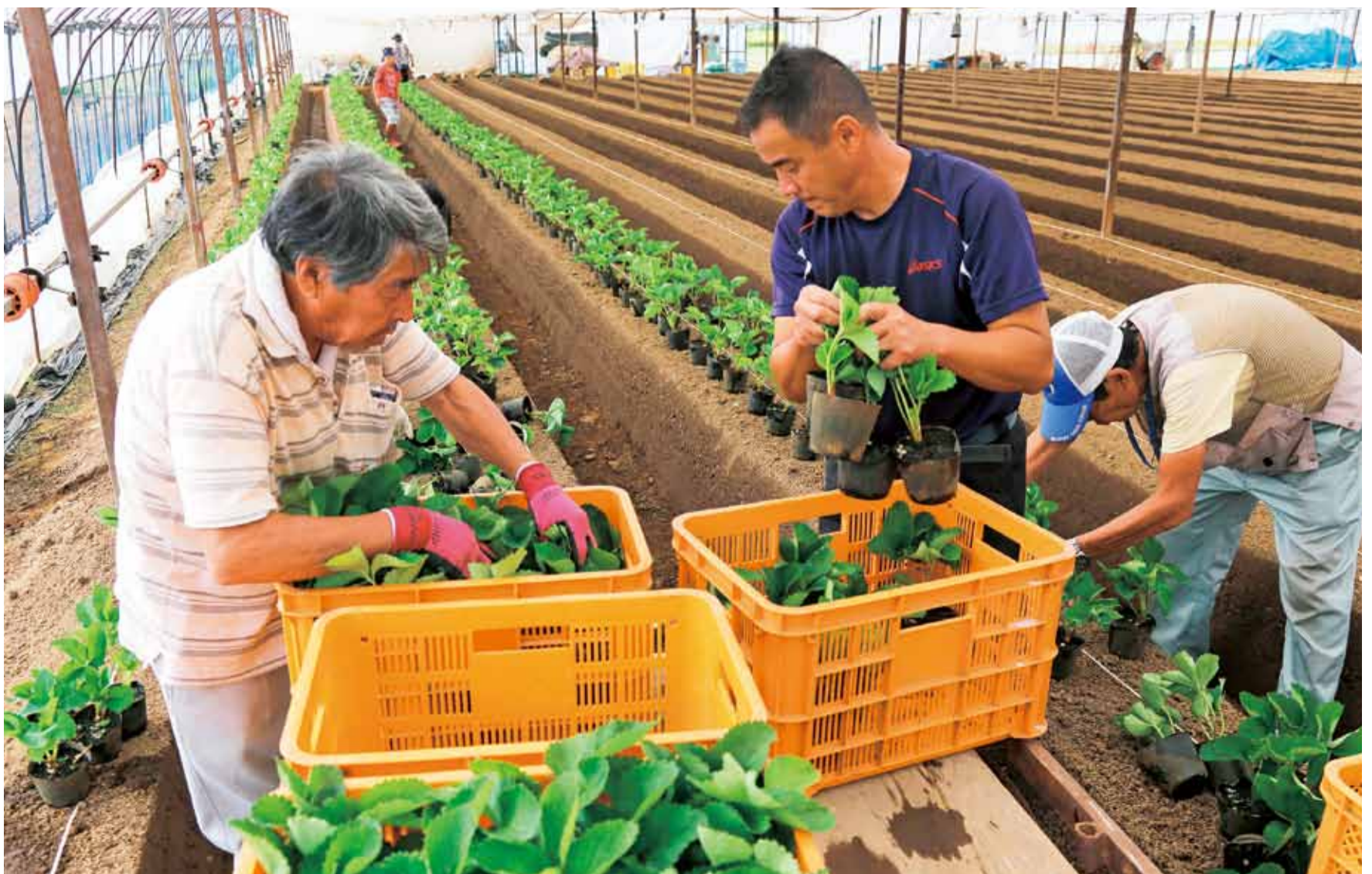
コンテナを載せた台車を畝をまたぐように置き、少しずつ動かしていきます