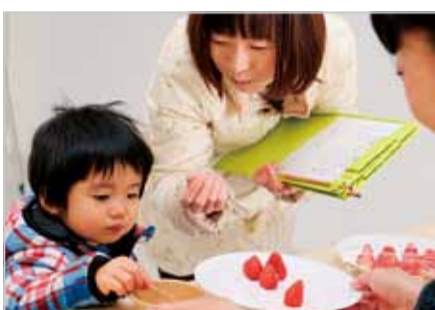
イチゴでにっこり

冬の収穫祭が1月17日、寺田縄の花菜ガーデンでありました。平塚産のイチゴを食べ比べる会場に用意されたのは、さちのか・紅ほっぺ・とちおとめの3品種150人分。イチゴの甘い香りが漂う中、品種を当てるクイズに参加した親子やカップルからは、満面の笑みがこぼれていました。