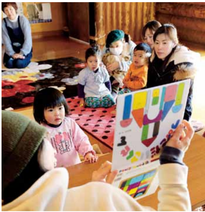
未就園児とその保護者が、毎月およそ10組参加しています

身の子育て経験を振り返ることもあると言います。お母さん同士で相談することが友達づくりにつながり、友達が增えるにつれて、公園などに行く機会も増えていきます。