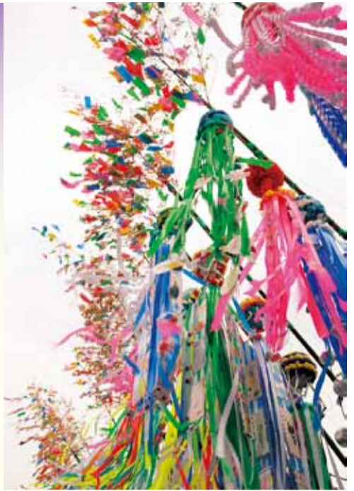
色鮮やかに装飾された七夕飾り