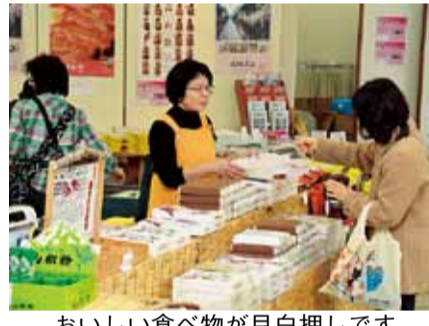
おいしい食べ物が目白押しです