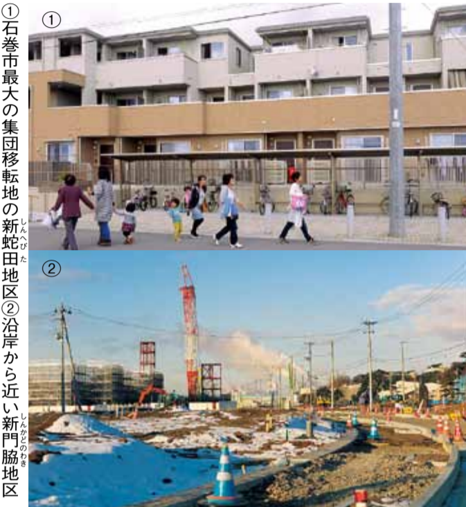
①石巻市最大の集団移転地の新蛇田地区 ②沿岸から近い新門脇地区

石巻市への人的支援では、これまで延べ47人の職員が復興支援に携わりました。今後とも復旧・再生・発展を支援するため職員の派遣などを継続していきます。