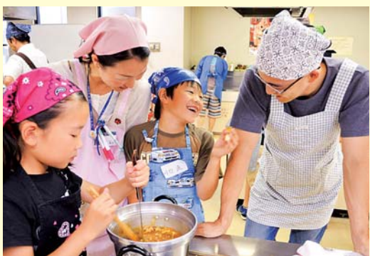
愛情が隠し味です

募集 全員の必要事項・子どもの学年を、電話・メールまたは直接、5月20日(金)〜31日(火)に、〒254-0047追分1-20中央公民館 ☎34-2111 yoko-k@へ。地区公民館でも応募できます。