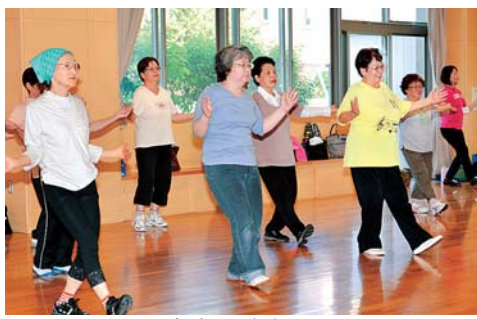
誰でも気軽に参加できます

健康の秘訣講座 健康に過ごすために、口と全身の病気の関係について歯科医が話します。 6月16日(木)午前10時～11時30分。保健センター。30人(先着順)。 ☎ 電話で、健康課☎55-2111へ。