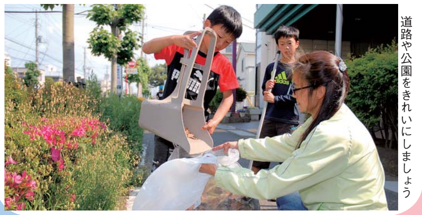
道路や公園をきれいにしましょう

ンスなどをします。さまざまな国の文化に触れ、国際交流の輪を広げませんか。6月5日(日)午前10時～午