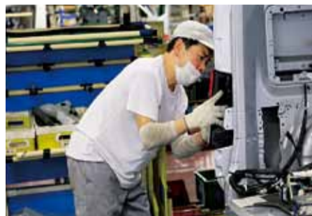
慎重に作業を進めます。後ろに見えるのがキット台車です

ほぼ全て人の手で取り付けていきます。ボディーが流れるラインと並行して動く青色の台車。この台車には、それぞれの車に取り付ける部品が積まれています。キット台車方式と名付けられ10年前から導入されています。以前は、さまざまな部品が置かれた中から適合する部品を選んでいましたが、選ぶ時間・手間・選択ミスがなくなり効率が上がりました。多車種混流生産を支える工夫で、今では日産のスタンダードです。