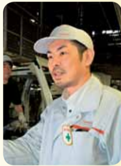
「1台1台、注文通りに作ります」と葉丸製造部長

機械化された作業が増えても、人の手でないとできない作業も多い車作りの現場。さまざまな作業ができる「多能工」を育てることを目標にし、15〜30人のチームで毎月受け持つ作業内容を変えています。また、同工場では、従事者全体の約3割が女性です。生産ラインの終盤の検査工程