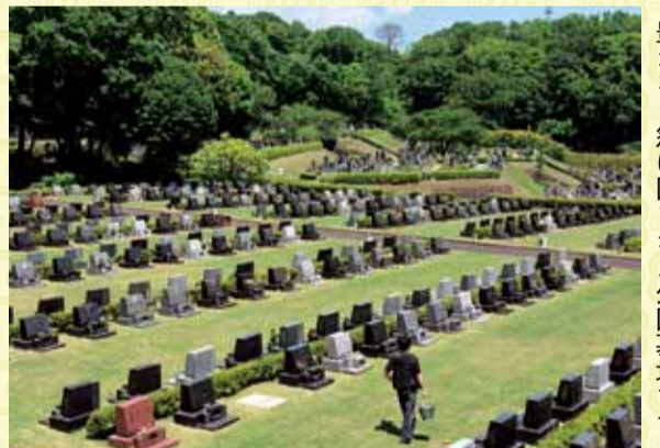
豊かな自然に囲まれた公園墓地です

次の条件を全て満たす方①7月1日現在、市内に1年以上在住②遺骨がある③市内に墓地がない④市税の滞納がない、など。 募集 平日の午前9時〜午後5時に⑥6月6日(月)・7日(火)、本館6階619会議室⑥8日(水)〜24日(金)、本館6階のみどり公園・水辺課 ☎21-9852で配る申込書を、郵送で、7月1日(金)までに、同課へ。26日(火)午後2時30分から、教育会館で公開抽選をします。