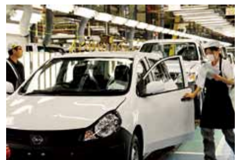
素早く正確に検査をしていきます