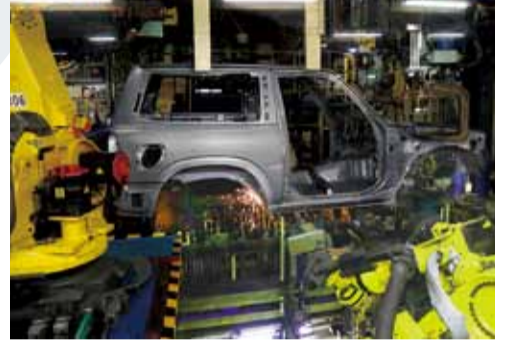
アームの先端は1,200度以上になります

② 溶接 約270台の黄色いロボットが活躍します。アームの先端についた銅のチップに電流を流して、熱でプレスしたボディーパネルを溶接します。ラインを流れるボディーは注文を受けた順番に並んでいます。ロボットが作業するラインの最終工程では溶接されたボディーを人が丁寧にチェックしていきます。