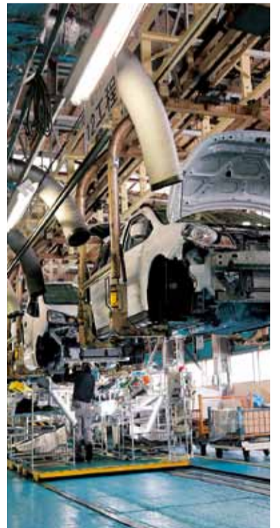
ボディーの下からガソリンタンクなどを取り付けます

⑤ 検査 ブレーキやエンジン、走行性など400項目以上を資格を持った検査員がチェックします。左右と天井からライトで照らし、外観をチェックする工程は人の目、そして手の感覚が全ての頼りとなります。この工程が完了すると、完成車として出荷されます。