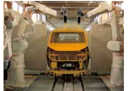
ほこりが入らないように厳重に管理された塗装スペース

③ 塗装 注文に合わせて、4,000~5,000色の塗料を作ることができます。1台の注文のためだけに調合することも。注文どおりの色に調合された塗料を、ロボットが1台1台吹き付けます。