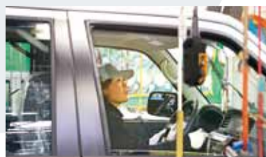
ハンドルを握り上部のモニターを見つめる女性は、日産での検査技能世界チャンピオンです。時速120kmまで加速し、メーターのチェックをします

⑤ 検査 ブレーキやエンジン、走行性など400項目以上を資格を持った検査員がチェックします。左右と天井からライトで照らし、外観をチェックする工程は人の目、そして手の感覚が全ての頼りとなります。この工程が完了すると、完成車として出荷されます。