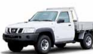
パトロールピックアップ

①約1万2,000台(パトロール)・約3,400台(パトロールピックアップ) ②海外専用車両で、中近東を中心にアフリカやオーストラリアなどへ輸出しています。パトロールはエチオピアでのPKO(国連平和維持活動)仕様もあります。パトロールピックアップはラクダの運搬に使われることもあります。