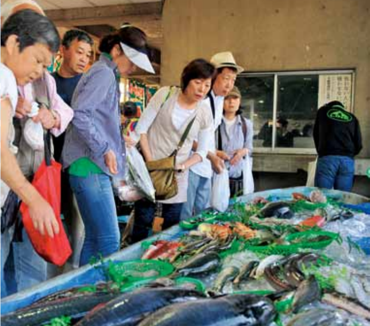
平塚沖でとれた新鮮な魚がたくさん並びます

水揚げされたばかりの新鮮な魚や地元で作られた干物などを販売するほか、マグロの解体実演や重量当てクイズをします。また、400食分の漁師鍋を無料で配ります。 6月12日(日)午前8時〜売り切れ次第終了。荒天の場合は19日(日)に延期。市水産物地方卸売市場(千石河岸28-11)。 ☎ 農水産課 ☎21-2066