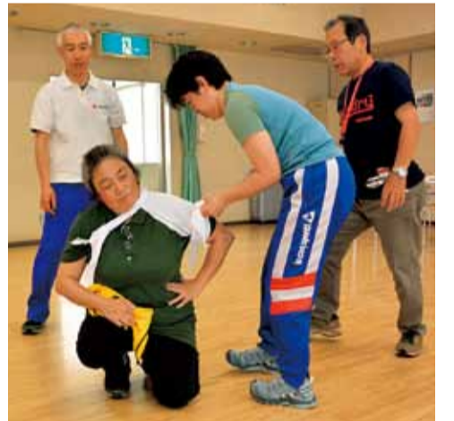
正しい救急法を学んで、緊急時の対応に備えましょう

必要事項・生年月日・開催日・講習会名を、はがきで、6月17日(金)までに、福祉総務課 ☎21-9862へ。