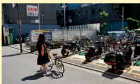
駅周辺の駐輪対策を進めます