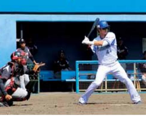
プロの試合を観戦しましょう

6月9日(木)午後6時試合開始。バッティングバレス相石スタジアムひらつか。チケットは当日券のみで、試合開始2時間前から