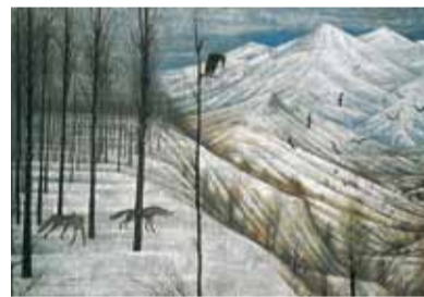
加山又造《冬》1957年 東京国立近代美術館蔵。10月25日〜11月27日に展示

■市民アートギャラリー 10月12日(水)〜15日(土)市文化祭書道公募展。18日(火)〜23日(日)市文化祭(写真・絵画・彫刻)公募展。27日(木)〜30日(日)わたしたちの絵画展。