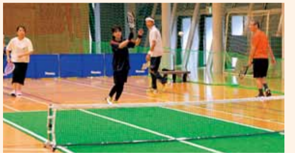
初心者の方でも気軽に参加できます

☎ 必要事項・年齢を、往復はがきで、〒254-0074大原1-1スポーツ課 ☎31-3060へ。