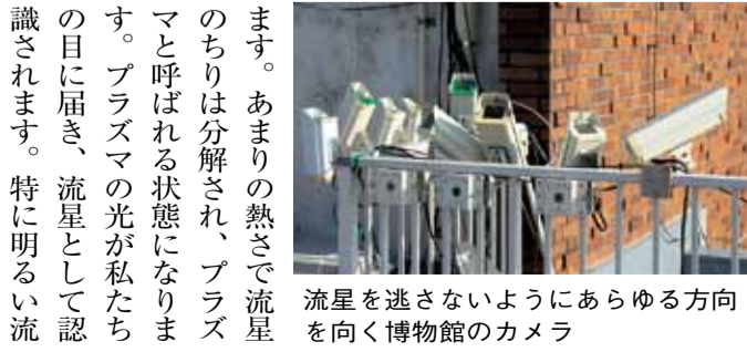
流星を逃さないようあらゆる方向を向く博物館のカメラ

皆さんは流れ星を見たことがありますか？ 左の写真は博物館の屋上に設置している、高感度ビデオカメラを使って撮影した流れ星です。宇宙のどこからともなく現れて、視野の中にふっと一筋の細い光を残す現象を、流星と呼びます。光は瞬間に消え去ってしまい、その後は、まるで今の出来事が幻であったかのように、空はすぐに静けさを取り戻します。