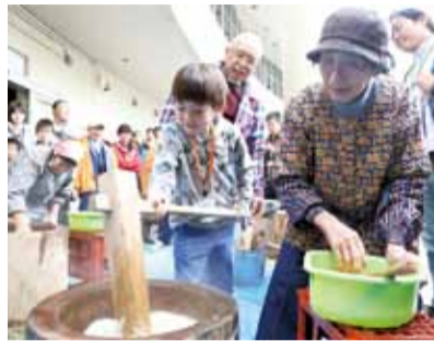
もちつき体験などをします

11月12日(土)午後1時30分～4時30分。美術館。小・中学生16人(抽選)・小学校3年