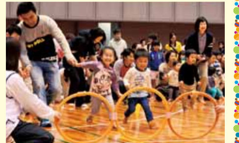
楽しいイベントが盛りだくさんです

運動遊びや、保育士による大型人形劇などがあります。10月29日(土)午前10時～11時30分。トッケイセキュリティ平塚総合体育館。未就学児と保護者300組(先着順)。 ☎ 必要事項 ・子どもの氏名と年齢を、はがき・ファクス・メールで、10月7日(金)から、保育課 ☎21-9842 ☎21-9738 hoikuka@へ。