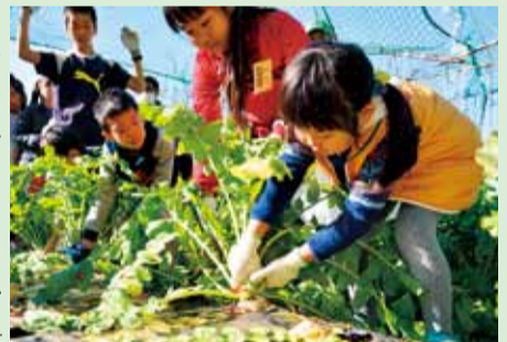
自然豊かなびわの里で活動しませんか

4月～平成30年2月に9回程度活動します。市内在住・在学で1年間活動できる、29年4月1日現在、小学校4年生～中学生32人(抽選、初めての方・経験年数の少ない方を優先)。2,000円。キャンプなどは別途費用がかかります。電話で、3月3日(金)～22日(水)に、びわ青少年の家 ☎59-0871へ。