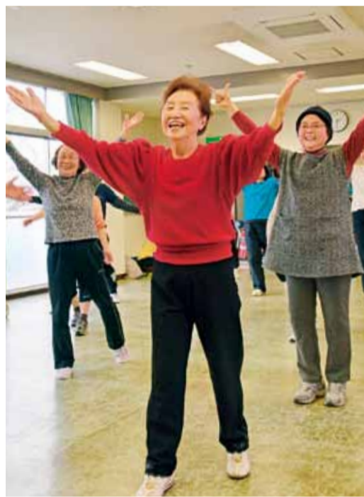
体を動かすうちに、参加者は自然と笑顔に

由な時間ができたんです。元気なうちにボランティア活動をしたかったと考えていた時に、たまたま広報ひらつかを見て健康推進員を知りました。「きっかけを振り返ります。「40年以上、趣味で続けていたヨガの経験も生かせるかも、と思ったからです」と続けます。