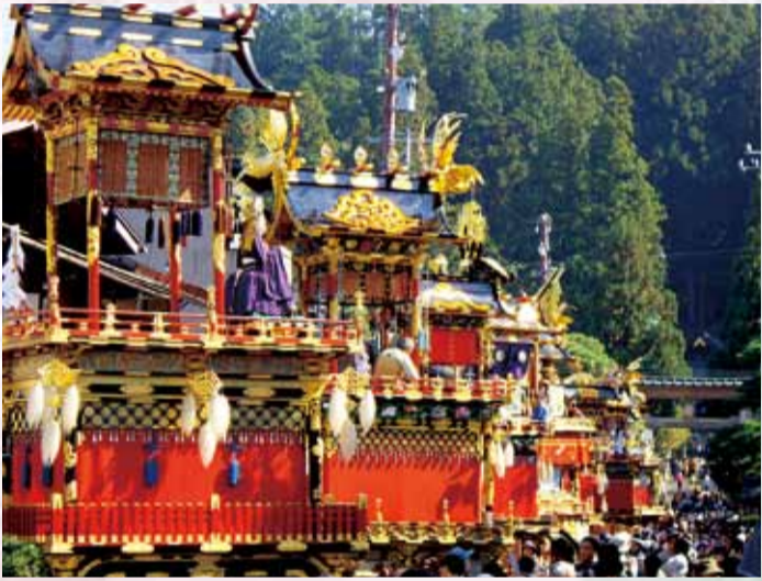
見どころ満載の高山市を堪能しませんか

電話で、3月3日(金)午前10時から、近畿日本ツーリスト株式会社湘南支店(観光庁長官登録旅行業第1944号・宮の前1-13甲南アセットビル9階)☎23-2811へ。