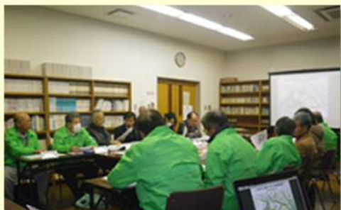
写真：設計説明会の様子 同じ上着の着用からも大神地区の団結力の強さがうかがえます。

新しい相模小学校は多様な学習内容や学習形態に対応できる設計になっているだけではなく、地域と共に子ども達の生活の場を造ることが提案されています。また、ツインシティ大神地区の小学校にふさわしい環境共生に考慮した学校づくりが盛り込まれていることも大きな特徴です。