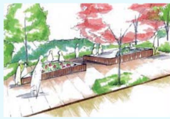
↑道路に面してクラスプランターを設置