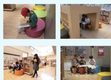
↑図書コーナーの利用イメージ