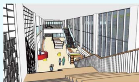
↑大階段から図書コーナーを見る(イメージ)