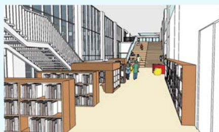
↑昇降口から図書コーナーを見る(イメージ)