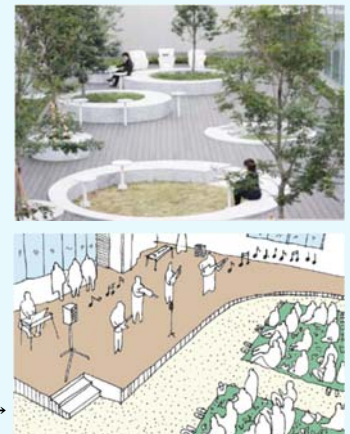
野外音楽演奏会などの利用イメージ

校舎の1階をコの字型とし(仮称)寄木モール側へ開き、中央のウッドデッキからテラスを囲む教室と一体的に利用できる計画とすることで、学年・クラス・地域の枠を超えた交流を可能にします。