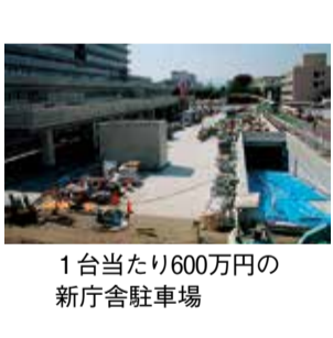
1台当たり600万円の 新庁舎駐車場

庁舎棟と駐車場棟を合わせた工事請負契約金額は当初から20億6千万円増額している。庁舎棟の工事請負変更契約は今回で建築が6回目、電気が5回目となる。変更する理由は何か。