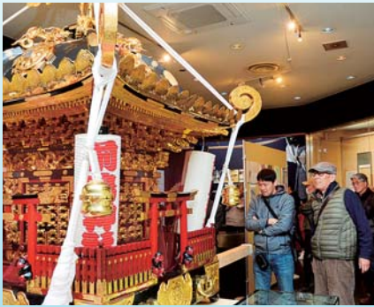
迫力ある神輿を鑑賞しませんか

特徴や見所などを語りします。28日(土)午後1時30分～3時。講堂。70人(当日先着順)。 ㊟ 博物館 ☎33-5111