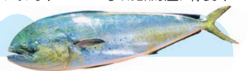
▲平塚のシイラ 見た目に反して、淡白であっさりした味わい。大きいものは2kg以上に育ちます