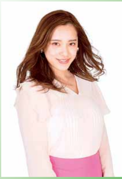
タレントの都丸さんが平塚競輪場をPRします

本年度のイメージキャラクターに、CMやバラエティー番組などに多数出演する都丸沙也華さんが就任しました。「自分と同世代の人も気軽に行ける平塚競輪場の魅力をPRしたい」と意気込む都丸さん。同競輪場では、5月に競輪界最高峰のレース、日本選手権競輪が開かれます。 平塚競輪場 ☎21-3935