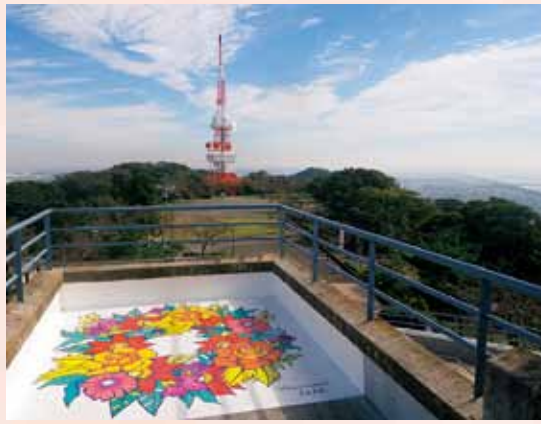
写真映えるスポットなどもある湘南平

知事登録旅行業2-494号・東豊田531-37) ☎55-1313 ☎55-5500②は4月10日(火)から、正午〜午後4時に、ピククパワー(神奈川県知事登録旅行業3-557号・浅間町7-4) ☎34-2306 ☎31-6701へ。