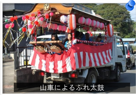
山車によるふれ太鼓

これから何回かにわたって、「まぼろしの八坂神社」について記していきます。（吉沢歴史クラブ記）