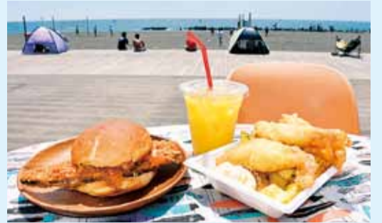
大きなフライが特徴のサバタツタバーガーサンド(650円・写真左)と地魚フィッシュ&チップス(800円)。

店頭で料理を受け取り振り向くと、海と空が目飛び込んできます。「何といてもこの最高のロケーションが自慢です。スポーツで疲れた体を休めるためにはもちろん、女子会などの集まりでも利用してほしいですね」と期待を込めます。