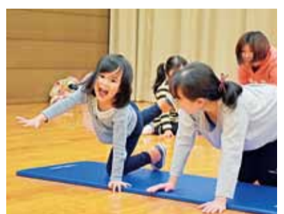
親子で運動を楽しみませんか

親子で運動を楽しみませんか 20組。4110円。 教室名・必要事項・年齢(⑥は子どもの氏名・年齢も)を、はがきで、6月15日(金)までに、〒254-005見附町31-10まちづくり財団スポーツ事業課☎35-0102へ。同財団ウェブからも応募できます。