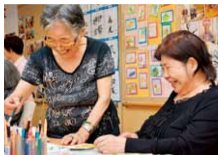
特技を生かして活動しませんか