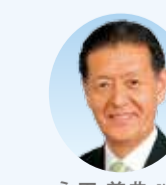
永田 美典 議員