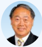
出村 光 議員