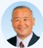
小泉 春雄 議員