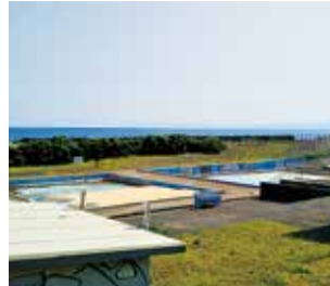
龍城ヶ丘プール跡地

龍城ヶ丘ゾーン整備 2020年までの完成ありきで進んでいるという声があるが、2020年の完成を目指していくのか。 市長 地域からの要望などを聞き、丁寧な説明を行いながら引き続きの目標として、2020年の一部オープンについて検討したい。 問 市民のための公園整備になるのかなどの声もあるが、どう考えているか。 市長 今回の手法は、民間のノウハウやいろいろな提案を活用して、都市公園の