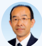
須藤 量久 議員