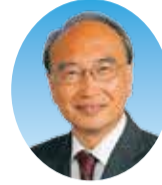
高山 和義 (日本共産党 平塚市議会議員団)