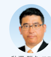
秋澤 雅久 議員