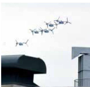
平塚上空を飛ぶオスプレイ

問 平塚市民にとって弾道ミサイルと軍用機事故では命のリスクはどちらが大きいか。防災危機管理部長 比較はできないと考える。