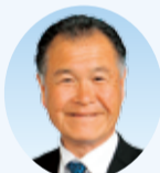
黒部 栄三 議員