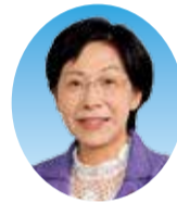
松本 敏子 (日本共産党 平塚市議会議員団)