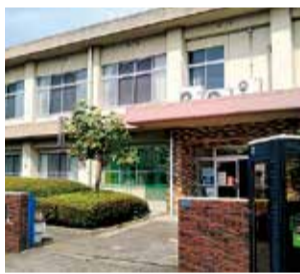
現在の四之宮公民館

を実施し、3月の条例改正に向けて進めていきたい。 四之宮の新たな拠点 さくら幼稚園の跡地利用として、地元から四之宮公民館の移設・新設に係る要望書が出された。新たな拠点へと生まれ変わる好機と考えるが、見解を伺う。 市長 四之宮公民館は立地に多くの課題があるため、現在の公民館をさくら幼稚園の跡地に移設・新設する方向で検討を重ねている。