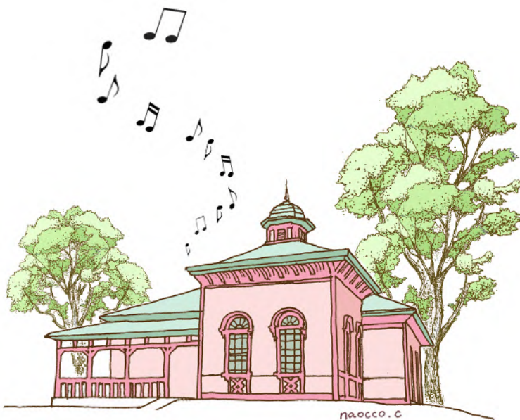
国登録有形文化財(建造物)