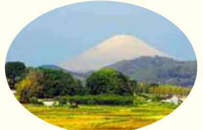
市内外への多様な眺望景観。(岡崎から望む富士山)