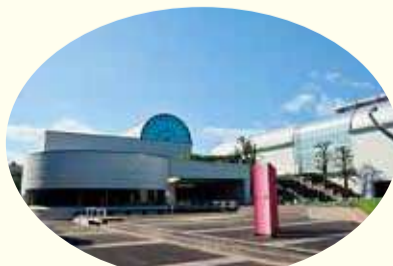
落ち着きと潤いのある都市景観。(文化ゾーン)