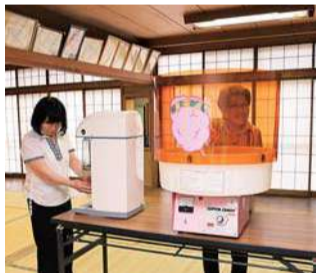
かき氷機や綿菓子機などを購入しました