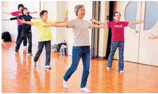
楽しみながら体を動かしませんか

健康長寿セミナー 健康長寿に役立つサプリメントの上手な使い方などを、医師が話します。