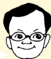
落合克宏 市長こらむ