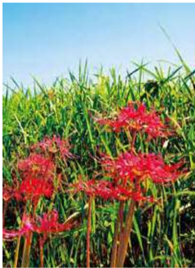
城所の土手に咲く曼珠沙華

同会では、12月〜2月ごろに咲く日本水仙、1月〜4月に咲く西洋水仙も植えていくほか、耕作放棄地をそば畑として活用するなど、自然と調和した景観づくりを進めています。