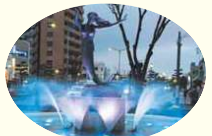
暮らしを彩る生活環境。(平塚駅南口広場の噴水)