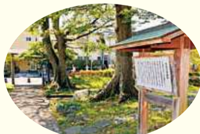
地域の個性や平塚の成り立ちを伝える歴史景観。(東海道平塚宿)