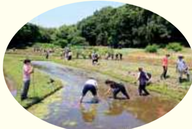
海、山、川など恵まれた自然景観。(土屋にある里山の田植え)

平成21年に市景観計画・景観条例を施行してから、市は『平塚らしさ』のある景観づくりに取り組んできました。「自然」「眺望」「歴史」「都市」「生活」に分類し、地域の特性を生かした景観を創出しています。