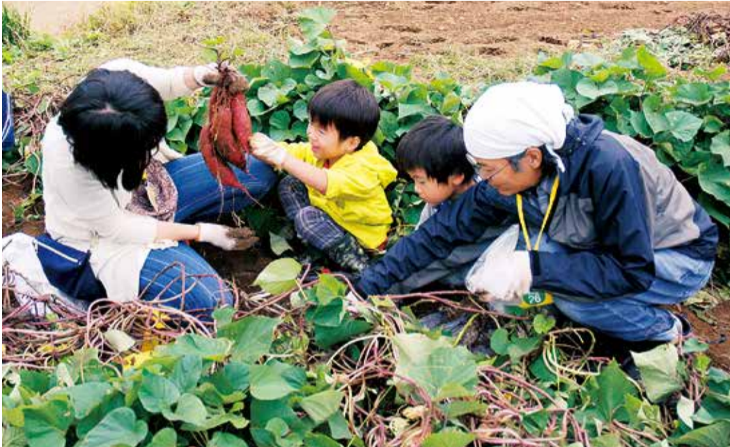
「みんなで楽しくサツマイモの収穫体験。」 花菜ガーデンでは、農業や園芸などを楽しく学べる講座が多数用意されています。