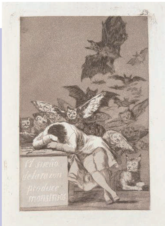
フランシスコ・デ・ゴヤ 《理性の眠りは怪物を生む》1799年

日時：2019年1月20日(日)、27日(日) 2回連続講座 13:30-16:30