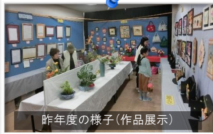
昨年度の様子(作品展示)