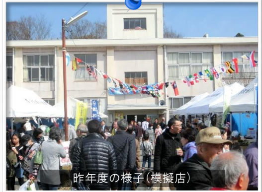
昨年度の様子(模擬店)