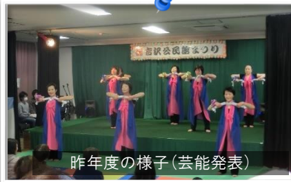
昨年度の様子(芸能発表)