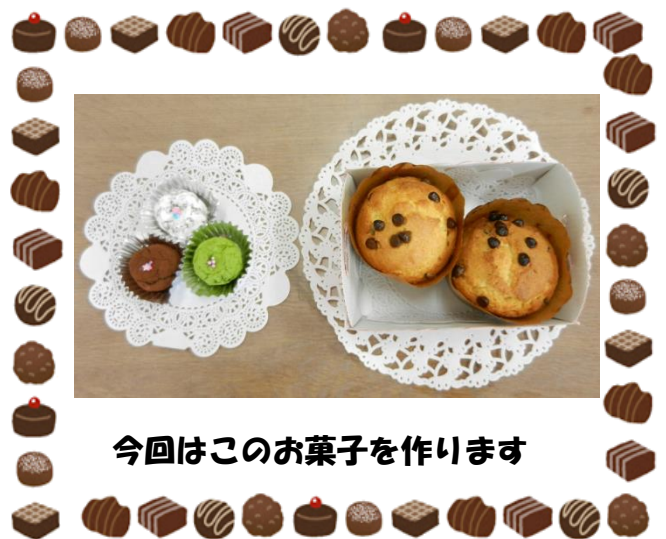
今回はこのお菓子を作ります