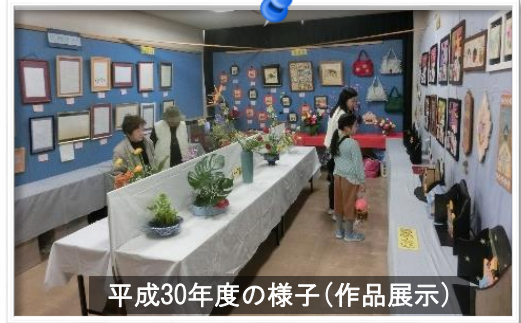
平成30年度の様子(作品展示)