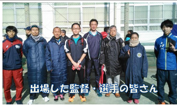
出場した監督・選手の皆さん

去る1月13日(日)に開催された第65回平塚市市内駅伝競走 大会・地区対抗の部において、花水地区代表チームは出場23 チーム中、10位と健闘しました。来年もさらなる上位をめざし 活躍が期待されます。監督、選手、チームの皆様、お疲れ様で した。地域の皆様の応援、ありがとうございました。